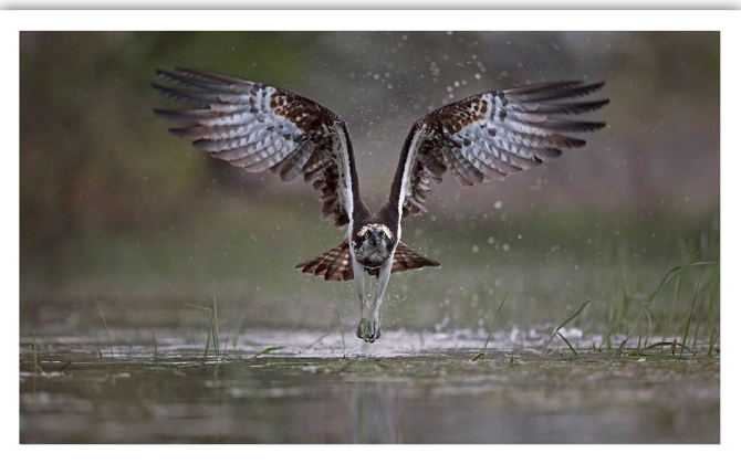
Le Balbuzard pêcheur chasse au crépuscule. Louis Marie Préau