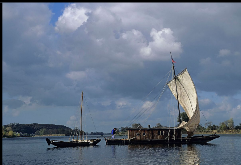
Un marinier de Loire navigue avec sa toue cabanée suivie d'un « futreau ». Jean-Baptiste Rabouan