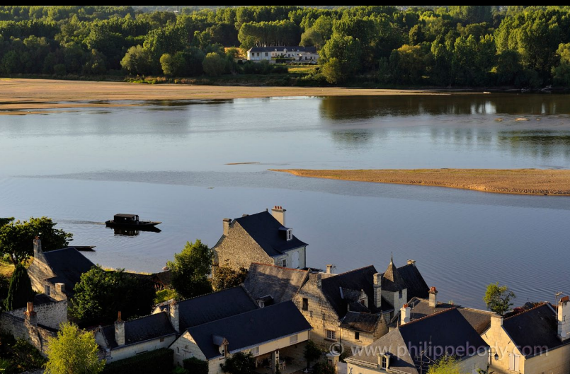
Devant le village de Candès Saint Martin, les cours de la Loire et de la Vienne se rejoignent enfin. Philippe Body

/// EXPOSITION DE PHOTOGRAPHIES /// 26 MARS > 31 DÉCEMBRE 2016 ///